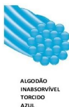
Figura 1 : Corte longitudinal do fio